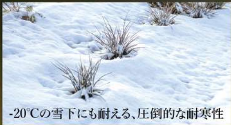
-20°Cの雪下にも耐える、圧倒的な耐寒性