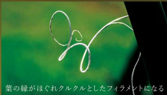
葉の縁がほぐれクルクルとしたフィラメントになる